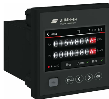
ESM с модулем индикации ЭНМИ